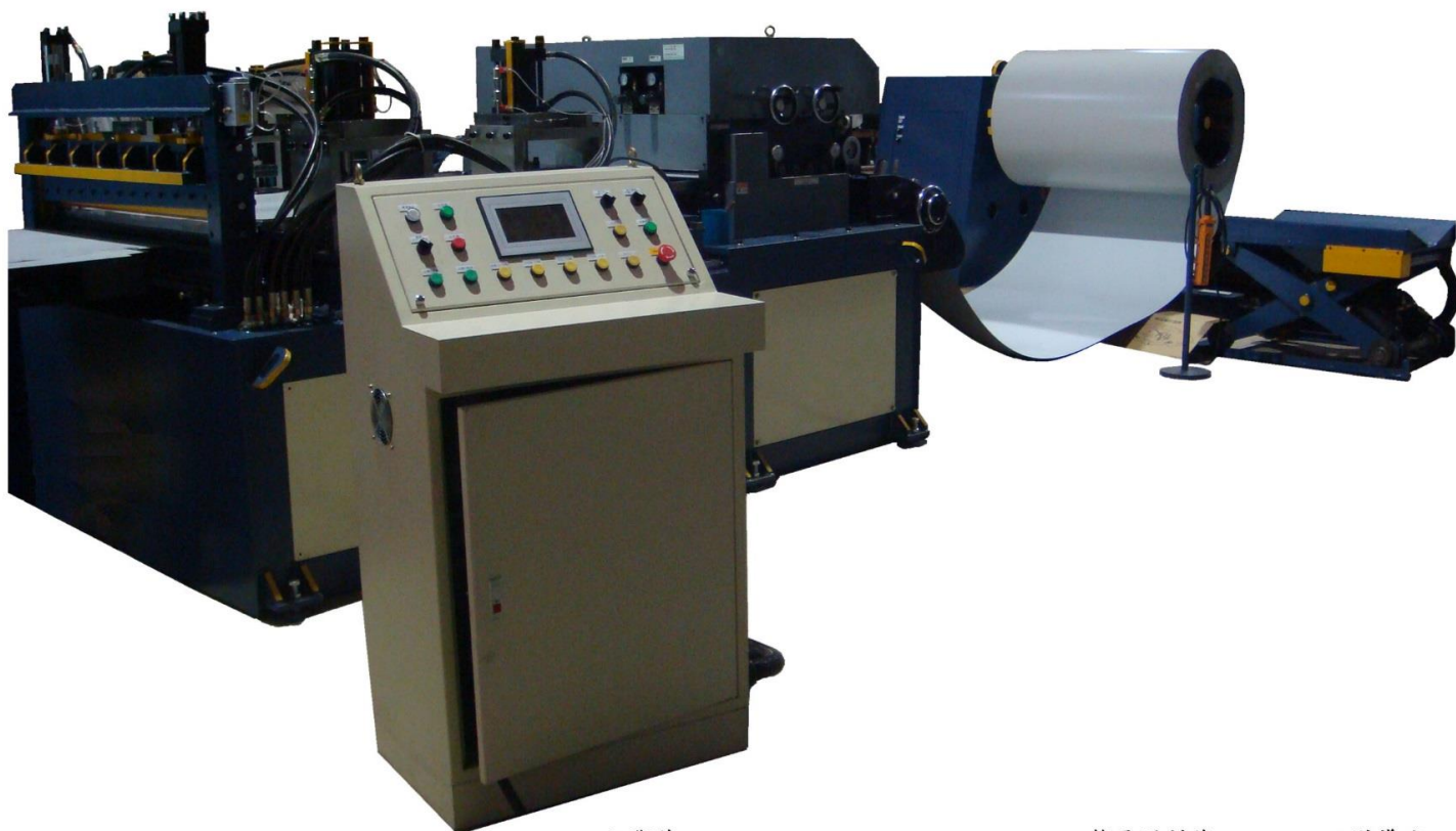
切斷機 Cutting Machine